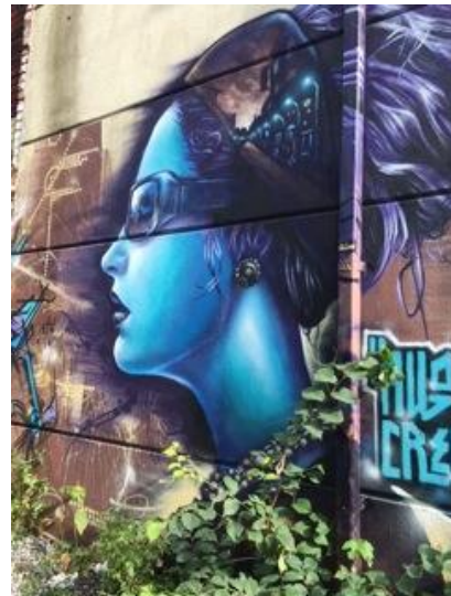
A la Toronto!