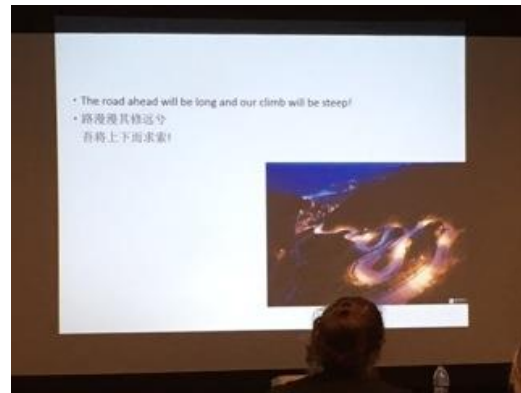
AAC in China