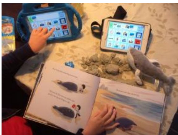
Anna en het boek i.c.m. met het PODD- systeem

We ontvingen de volgende foto's van onze gebruikers: