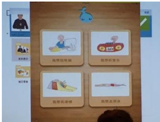
Antropologie en AAC!