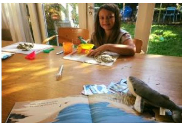
Maud in samenspel!